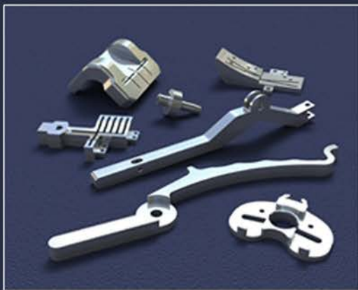
整形外科器械部件

Penn United 坚守对客户绝对诚信的承诺，我们的医疗团队可提供高精度的制造服务。自1971年起，我们技术娴熟的技术团队就开始为包括医疗在内的多个行业提供高精度的解决方案。我们已获得ISO认证并符合FDA（美国食品及药物管理局）标准，我们准备着接受并满足您的最具挑战性的应用需求。