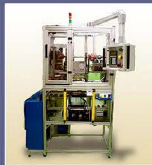
定制的自动化设备